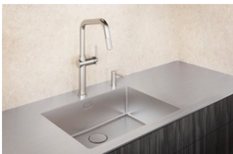
Linero Becken mit eFlow Desino, flächenbündig eingeschweisst in Spezialoberfläche Warmgewalzt