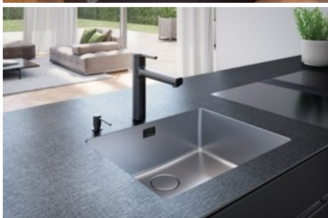
Linero mit eFlow Desino, flächenbündig eingeschweisst in Spezialoberfläche Xrange Black

Diese Meldung kann unter https://www.presseportal.ch/de/pm/100096608/100923129 abgerufen werden.