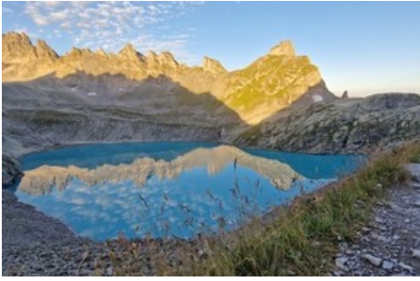
Wildsee auf der 5-Seen-Wanderung / Pizolbahnen