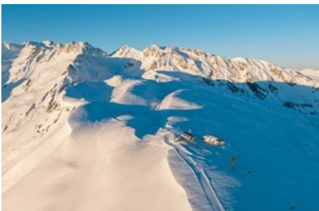
Skigebiet Pizol / Pizolbahnen