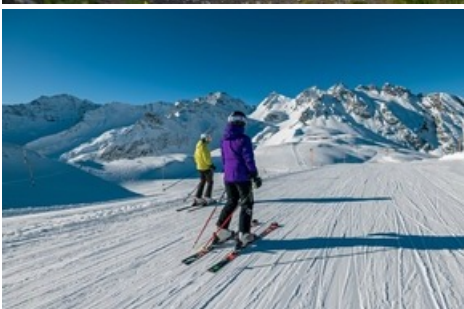
Skiberg Pizol / Pizolbahnen