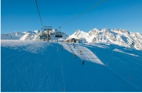
Schneereicher Winter 2023/24 / Pizolbahnen

Diese Meldung kann unter https://www.presseportal.ch/de/pm/100085818/100923535 abgerufen werden.