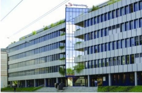
Hauptsitz der Telekurs Group an der Hardturmstrasse, Zürich Texte complémentaire par ots. L'utilisation de cette image est pour des buts redactionnels gratuite. Reproduction sous indication de source: "obs/Telekurs Holding"

Diese Meldung kann unter https://www.presseportal.ch/fr/pm/100004479/100492776 abgerufen werden.