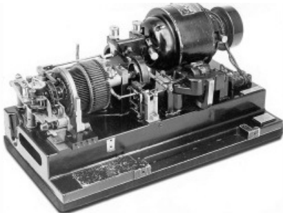
Ticker de la Bourse de 1930. Texte complémentaire par ots. L'utilisatin de cette image est pour des buts redactionnels gratuite.