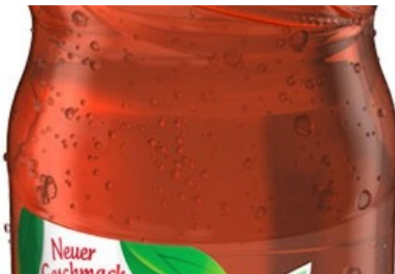
Nestea Lemon. La bouteille de 0,5 litres légère en PET