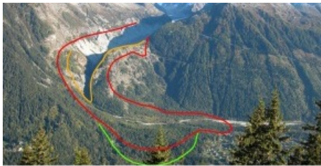
Ausdehnung des Mer-de-Glace-Gletschers in den Jahren 1644 (grün), 1821 (rot) und 1895 (orange). Zwischen 1821 und 1895 zog sich der Gletscher um 1,2 Kilometer zurück. Foto: © S. Nussbaumer/SNF Abdruck mit Autorenangabe und nur zu redaktionellen Zwecken. Extension de la Mer de Glace en 1644 (vert), 1821 (rouge) et 1895 (orange). Entre 1821 et 1895, le glacier a reculé de 1.2 kilomÈtres. Photo :© S. Nussbaumer/FNS. Reproduction autorisÈe avec mention de l'auteur et uniquement dans un but rÈdactionnel.

Bildlegende: Ausdehnung des Mer-de-Glace-Gletschers in den Jahren 1644 (grün), 1821 (rot) und 1895 (orange). Zwischen 1821 und 1895 zog sich der Gletscher um 1,2 Kilometer zurück. Foto: © S. Nussbaumer/SNF. Abdruck mit Autorenangabe und nur zu redaktionellen Zwecken. L'Ègende: Extension de la Mer de Glace en 1644 (vert), 1821 (rouge) et 1895 (orange). Entre 1821 et 1895, le glacier a reculé de 1.2 kilomÈtres. Photo :© S. Nussbaumer/FNS. Reproduction autorisÈe avec mention de l'auteur et uniquement dans un but rÈdactionnel.