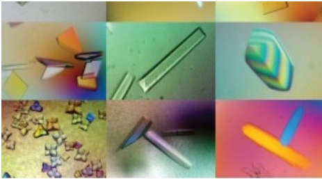
Was auf dem ersten Blick aussieht wie abgepackte Bonbons, sind wertvolle Kristalle aus Eiweissen. Sie sind schwierig zu züchten, aber können im Fall der Fettsäure-Synthese in der Bildmitte helfen, neue Medikamente gegen Krebs zu entwickeln. © The Ban Lab, Institute of Molecular Biology and Biophysics/SNF Abdruck mit Autorengabe und nur zu redaktionellen Zwecken.

Bildlegende: Was auf den ersten Blick aussieht wie abgepackte Bonbons, sind wertvolle Kristalle aus Eiweissen. Sie sind schwierig zu züchten, aber können im Fall der Fettsäure-Synthese in der Bildmitte helfen, neue Medikamente gegen Krebs zu entwickeln. © The Ban Lab, Institute of Molecular Biology and Biophysics/SNF Abdruck mit Autorengabe und nur zu redaktionellen Zwecken. Légende: On dirait des bonbons dans leur emballage, mais il s'agit en réalité de précieux cristaux de protéines. Ils sont très difficiles à cultiver et ne dans le cas de l'acide gras synthase (image au centre) ne susceptibles de contribuer au développement de nouveaux médicaments contre le cancer. © The Ban Lab, Institute of Molecular Biology and Biophysics/SNF Reproduction autorisée avec mention de l'auteur et uniquement dans un but rédactionnel.