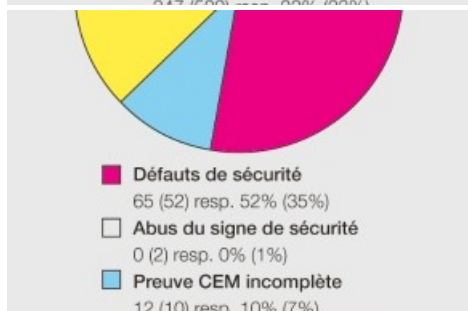
Diagramme matériels défectueux. / Texte complémentaire par ots et sur www.presseportal.ch . L'utilisation de cette image est pour des buts rédactionnels gratuite. Publication sous indication de source: "obs/Inspection fédérale des installations à courant fort ESTI"

Diagramme matériels contrôlés. / Texte complémentaire par ots et sur www.presseportal.ch . L'utilisation de cette image est pour des buts rédactionnels gratuite. Publication sous indication de source: "obs/Inspection fédérale des installations à courant fort ESTI"