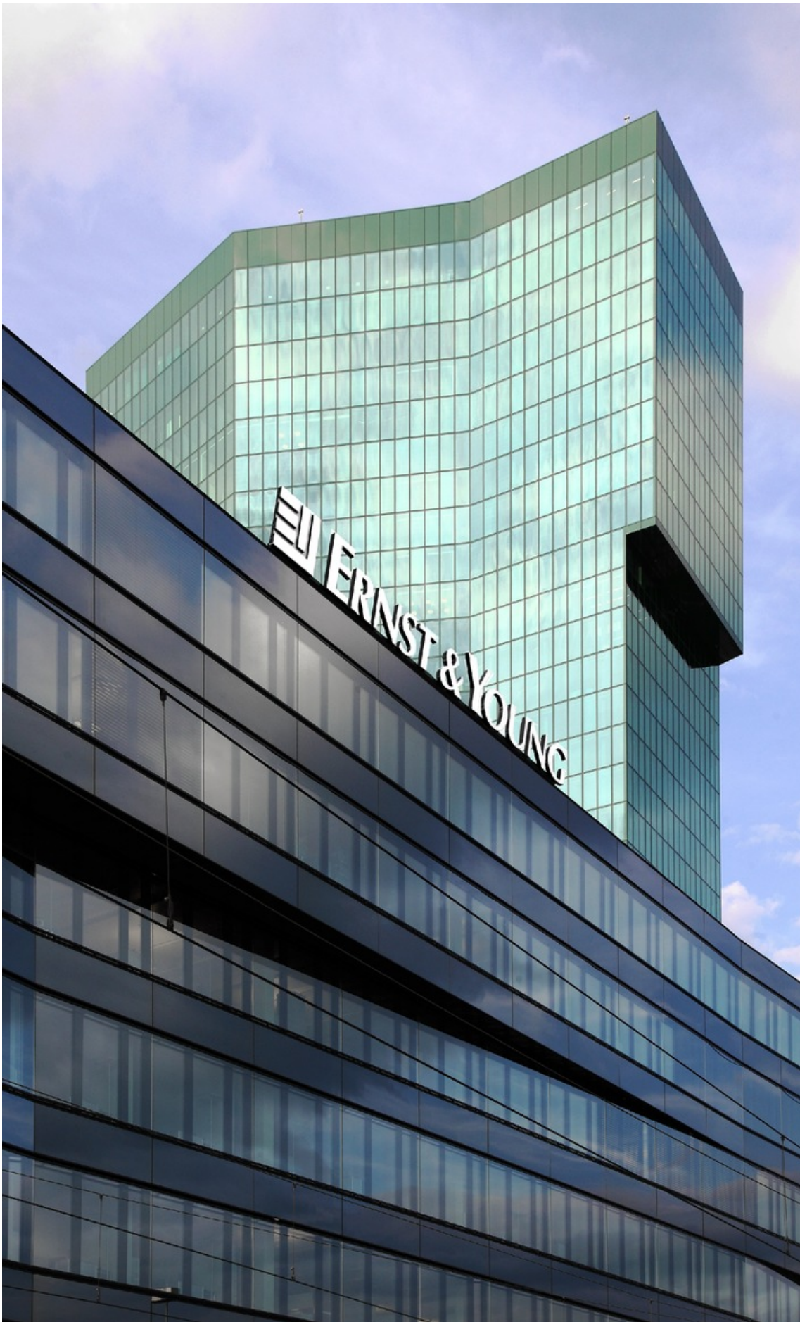
Zurich (ots) -

Dès aujourd'hui, Ernst & Young, société d'audit et de conseil, n'a plus qu'une seule adresse à Zurich: l'immeuble de prestige «platform», oeuvre des architectes Gigon/Guyer. A proximité immédiate de la Prime Tower, celui-ci abrite un millier de places de travail. Son aménagement répond très exactement aux besoins d'Ernst & Young. Ce nouveau siège permettra une collaboration