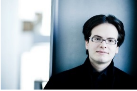
Francesco Piemontesi

Diese Meldung kann unter https://www.presseportal.ch/fr/pm/100009795/100706434 abgerufen werden.