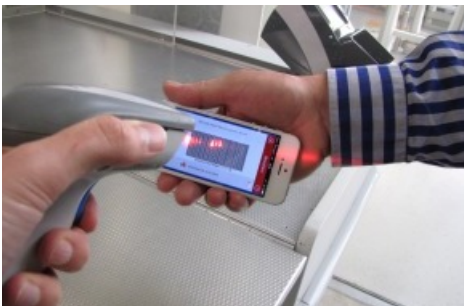
L'App JUMBO Card à la caisse. Texte complémentaire par OTS et sur www.presseportal.ch . L'utilisation de cette image est pour des buts rédactionnels gratuite.