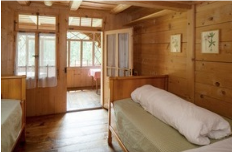
Hôtel Waldrand-Pochtenalp, l'Hôtel historique de l'année 2016 / Texte complémentaire par ots et sur www.presseportal.ch/fr/nr/100007695 / L'utilisation de cette image est pour des buts rédactionnels gratuite.