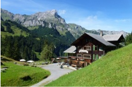
Hôtel Waldrand-Pochtenalp: l'Hôtel historique de l'année 2016 / Texte complémentaire par ots et sur www.presseportal.ch/fr/nr/100007695 / L'utilisation de cette image est pour des buts rédactionnels gratuite.