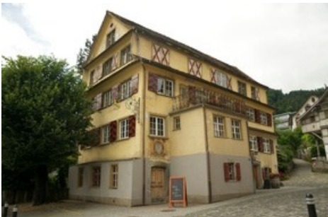
Restaurant Rössli, Balgach, le Restaurant historique de l'année 2016 / Texte complémentaire par ots et sur www.presseportal.ch/fr/nr/100007695 / L'utilisation de cette image est pour des buts rédactionnels gratuite.