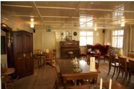
Restaurant Rössli, Balgach, le Restaurant historique de l'année 2016 / Texte complémentaire par ots et sur www.presseportal.ch/fr/nr/100007695 / L'utilisation de cette image est pour des buts rédactionnels gratuite.

Diese Meldung kann unter https://www.presseportal.ch/fr/pm/100007695/100776967 abgerufen werden.