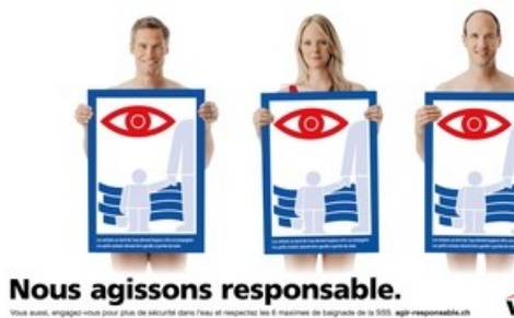
Image de la campagne "nous agissons responsables". Texte complémentaire par ots et sur www.presseportal.ch/fr/nr/100061916 / L'utilisation de cette image est pour des buts rédactionnels gratuite.

Diese Meldung kann unter https://www.presseportal.ch/fr/pm/100061916/100817438 abgerufen werden.