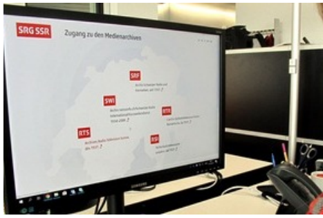
Texte complémentaire par ots et sur www.presseportal.ch/fr/nr/100014224/ L'utilisation de cette image est pour des buts rédactionnels gratuite.

Diese Meldung kann unter https://www.presseportal.ch/fr/pm/100014224/100821328 abgerufen werden.