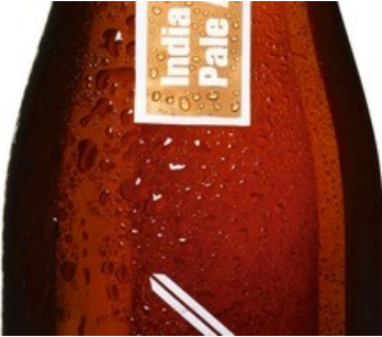
Doppelleu India Pale Ale