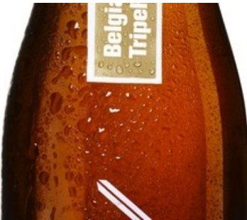
Doppelleu Belgian Tripel