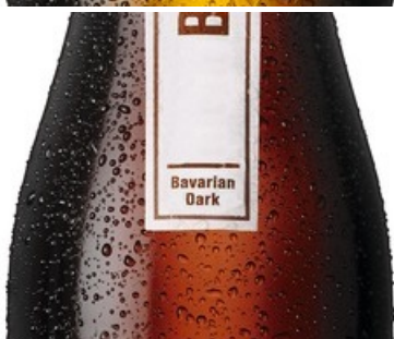
Boxer Edition Brunette