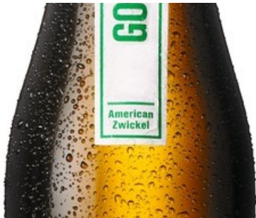
Boxer Edition Gourmande