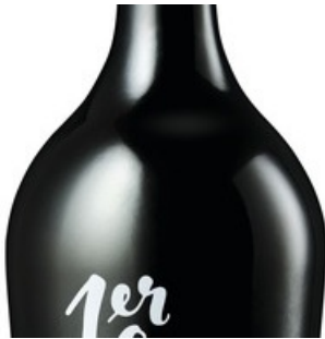
1er Cru 02

Diese Meldung kann unter https://www.presseportal.ch/fr/pm/100068398/100830914 abgerufen werden.