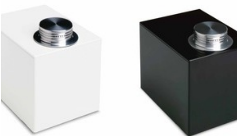
Diffuseur sans pied CWS AmbianceLine