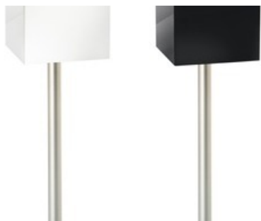
Diffuseur avec pied CWS AmbianceLine

Diese Meldung kann unter https://www.presseportal.ch/fr/pm/100012574/100831721 abgerufen werden.