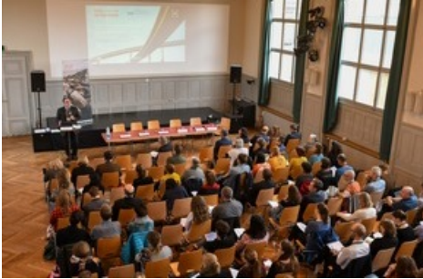
Evénement 4ème table ronde d'expert-e-s du du SFM et le nccr - on the move sur l'évolution de la politique fédérale des migrations. Texte complémentaire par ots et sur www.presseportal.ch/fr/nr/100061183 / L'utilisation de cette image est pour des buts rédactionnels gratuite.