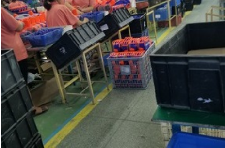
Le bâtiment de production de l'usine Ever Front. L'usine emploie plus de 3000 personnes.

Diese Meldung kann unter https://www.presseportal.ch/fr/pm/100001955/100837001 abgerufen werden.