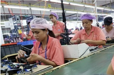
Travailleuses de l'usine Ever Front : production de jouets Hasbro