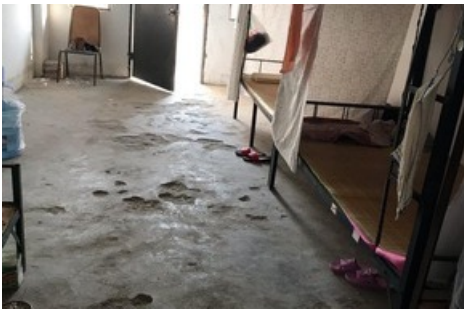
Dortoir de de l'usine Wing Fai qui produit notamment pour Lego.