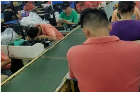
Le travail sur la chaîne de montage de l'usine Ever Front: heures supplémentaires excessives et épuisement.