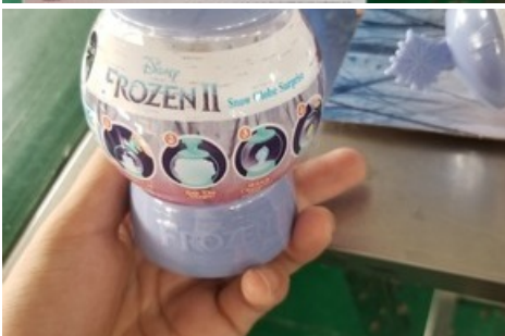
Boule à neige surprise « La Reine des Neiges 2 » de l'usine Kong Xing