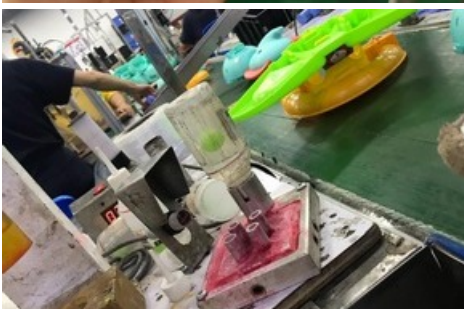
La colle et les produits chimiques constituent un risque pour la santé des travailleurs. Tapis roulant avec jouets en plastique de l'usine Foshan Mattel.