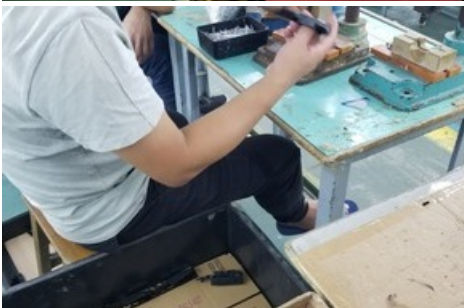
Les travailleurs de l'usine Ever Front produisent des jouets en moyenne 11 heures par jour.