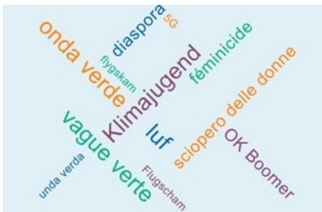
Les mots de l'année 2019 en Suisse