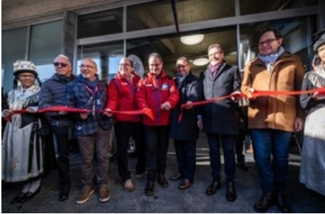
Le nouveau hub de transports publics à Fiesch est ouvert □7.12.2019