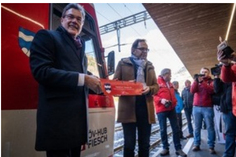
Baptême du train "Komet" Fiesch □7.12.2019