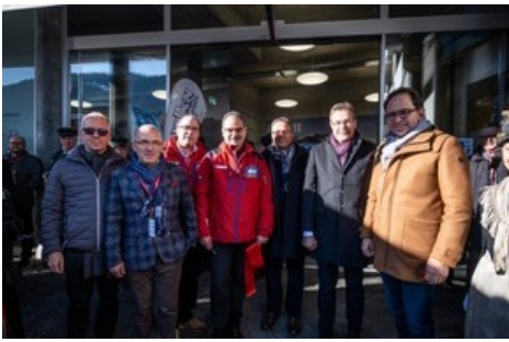
Le nouveau hub de transports publics à Fiesch est ouvert □7.12.2019