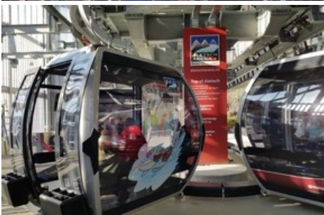
La télécabine la plus rapide de Suisse