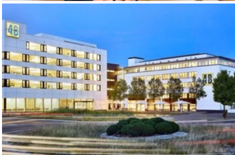
Siège de 4B à Hochdorf près de Lucerne