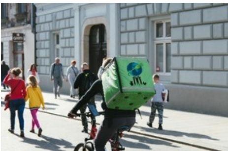
Trois des services de livraison internationaux étudiés sont également actifs en Suisse : Just Eat (Eat.ch), TakeAway et Uber Eats