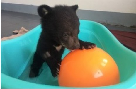
Mochi apprécie déjà les baignades

Diese Meldung kann unter https://www.presseportal.ch/fr/pm/100004691/100848597 abgerufen werden.