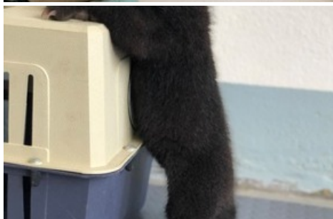
Mochi découvre son foyer d'accueil