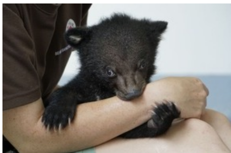
Vietnam, Ninh Binh | 2020 05 22 | Bear cub Mochi's first days at BSNB, Vietnam.