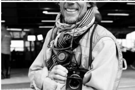
David Carlier est un photographe, cinéaste et aventurier suisse. Depuis trois ans, il capture les glaciers de sa patrie pour la postérité, à pied, en parapente et au moyen de son petit avion Ecolight.