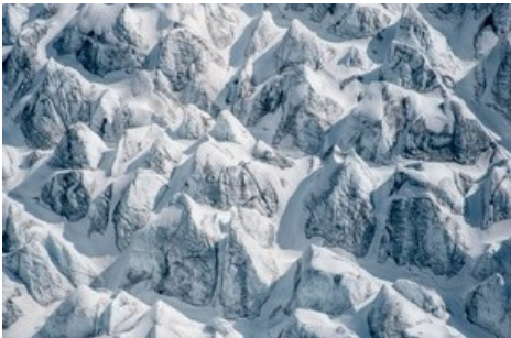
Les contours du Grand glacier d'Aletsch

Diese Meldung kann unter https://www.presseportal.ch/fr/pm/100070233/100850086 abgerufen werden.