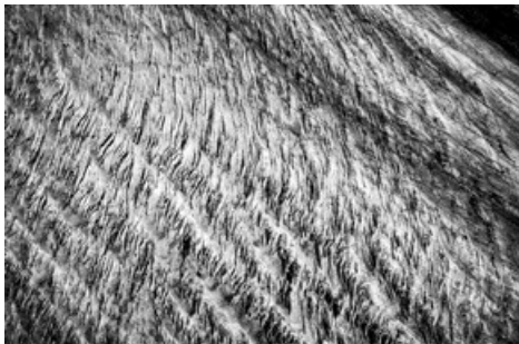
Le Grand Glacier d'Aletsch en noir et blanc.