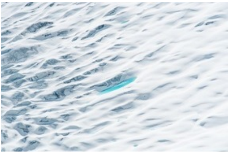
Géants en mouvement - Photo de la série Giants in Motion