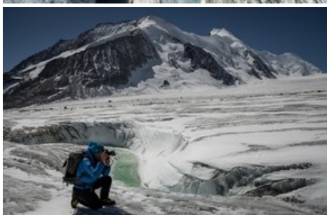
David Carlier est un photographe, cinéaste et aventurier suisse. Depuis trois ans, il capture les glaciers de sa patrie pour la postérité, à pied, en parapente et au moyen de son petit avion Ecolight. .