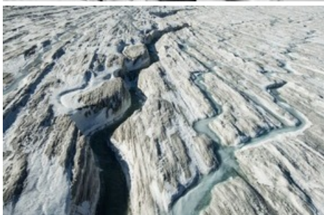
Giants in Motion - le Grand Glacier d'Aletsch