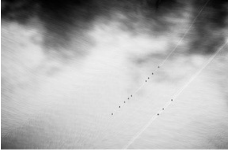
photographie en noir et blanc