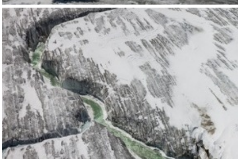
Géants en mouvement - Photo de la série Giants in Motion