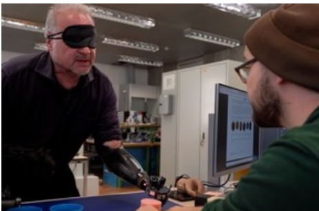
L'équipe BFH HuCE pendant l'entraînement.