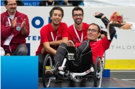
L'équipe BFH-CybaTrike a remporté la médaille de bronze lors de l'édition 2016 du Cybathlon.