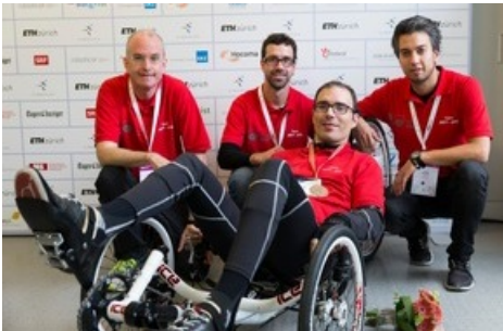
L'équipe BFH-CybaTrike au Cybathlon 2016