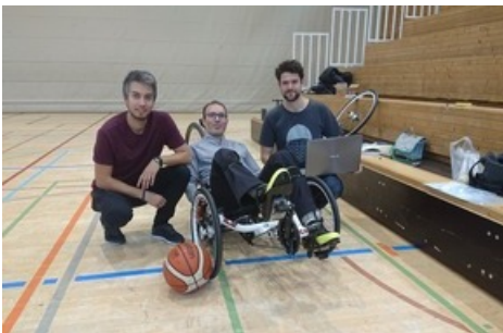
L'équipe BFH-CybaTrike pendant l'entraînement.