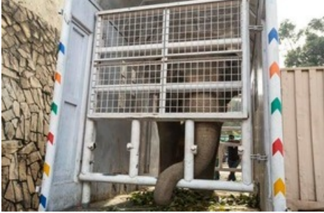
L'éléphant Kaavan s'envole pour le Cambodge.

Diese Meldung kann unter https://www.presseportal.ch/fr/pm/100004691/100860810 abgerufen werden.