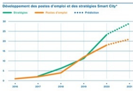
Développement des postes d'emploi et des stratégies Smart City