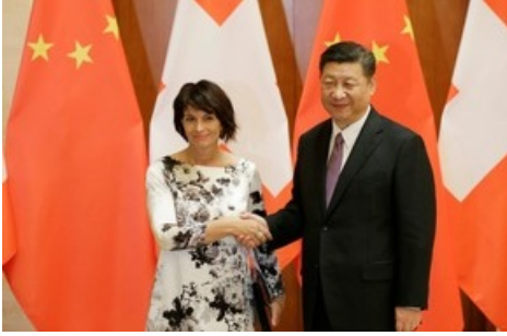
La présidente suisse Doris Leuthard et le président chinois Xi Jinping à Pékin en mai 2017.