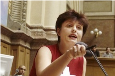
Anita Fetz SP/BS débat, pour une fois en patriote, de l'adhésion de la Suisse à l'ONU, le mardi 18 septembre 2001 à Berne lors de la séance du Conseil national.