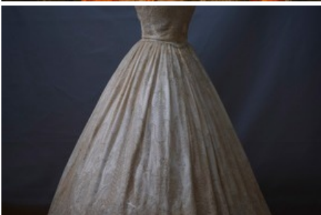
Robe de bal (vers 1860) en dentelle faite main qui aurait appartenu à la dernière impératrice de France, Eugénie de Montijo.