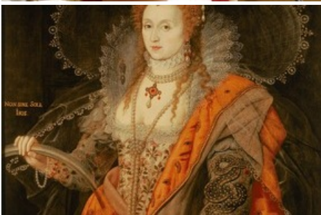
Elizabeth I. "Rainbow Portrait", 1600-1602, attribué à Marcus Gheeraerts le Jeune Huile sur toile, Collection du Marquis de Salisbury, exposée à la Hatfield House, Londres.