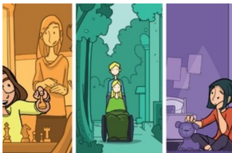
BD « Les enfants parlent de la SLA »

Diese Meldung kann unter https://www.presseportal.ch/fr/pm/100068017/100866857 abgerufen werden.