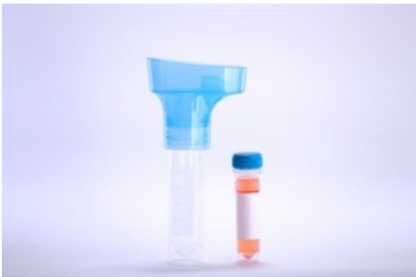
test de crachat