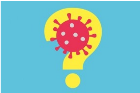
Autotests coronavirus en pharmacies

Diese Meldung kann unter https://www.presseportal.ch/fr/pm/100004115/100868307 abgerufen werden.