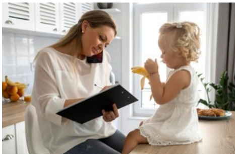
Les mères célibataires font énormément au quotidien