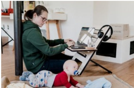
Comment les mères seules suisses vivent leurs rencontres