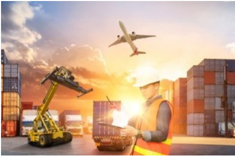
La Poste a proposé aux visiteurs une visite virtuelle des centres de colis de Härkingen, Cadenazzo et Frauenfeld.