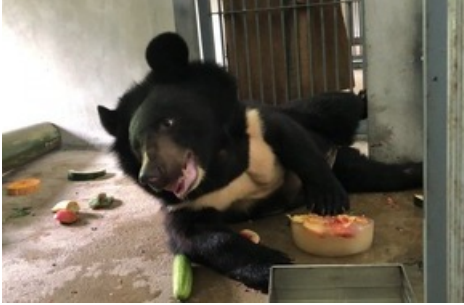
Un ancien ours à bile sauvé.

Diese Meldung kann unter https://www.presseportal.ch/fr/pm/100004691/100872879 abgerufen werden.