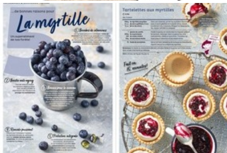
Pâtisserie et sucreries

Diese Meldung kann unter https://www.presseportal.ch/fr/pm/100068198/100875846 abgerufen werden.