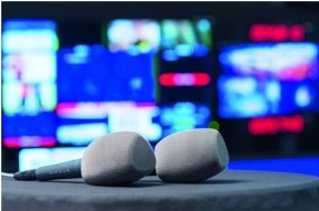
Texte complémentaire par ots et sur www.presseportal.ch/fr/nr/100014224 / L'utilisation de cette image est pour des buts rédactionnels gratuite.

Diese Meldung kann unter https://www.presseportal.ch/fr/pm/100014224/100880029 abgerufen werden.