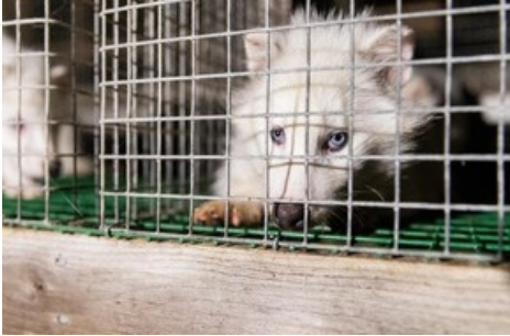
Les animaux élevés dans des fermes à fourrure souffrent toute leur vie.

Diese Meldung kann unter https://www.presseportal.ch/fr/pm/100004691/100882806 abgerufen werden.