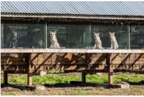
Les animaux élevés dans des fermes à fourrure souffrent toute leur vie.