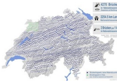
Visualisation du nombre de structures porteuses de ponts sur le réseau des routes nationales suisses