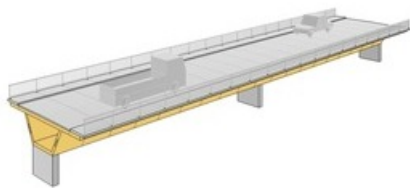
Visualisation d'un pont