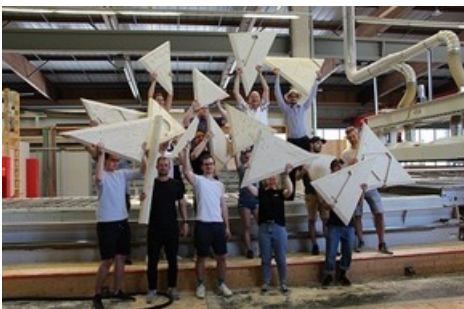
Des étudiant-e-s et des enseignant-e-s fiers de présenter les premiers éléments grandeur nature de *rtbt* ArtBeat.