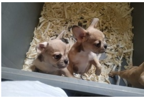
Des chiots vendus sans papiers en Bulgarie.