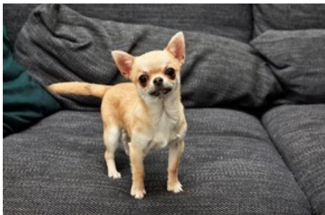
Un chiot acheté pendant la pandémie de Covid-19.