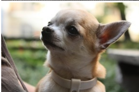
Commerce illégal de chiots sur un marché en République tchèque.