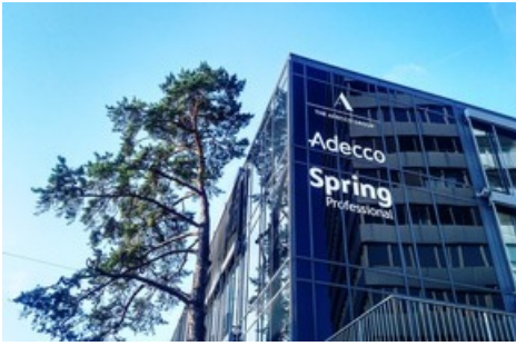
The Adecco Group Switzerland Office