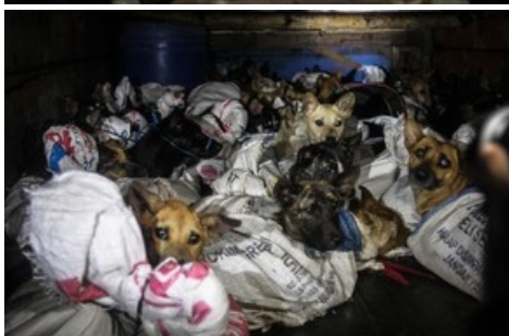
Une action de sauvetage a permis de sauver 53 chiens de l'abattoir.

Diese Meldung kann unter https://www.presseportal.ch/fr/pm/100004691/100891157 abgerufen werden.