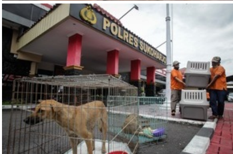
De nombreux chiens sont destinés à être mangés en Indonésie.