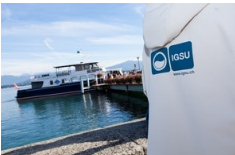
«Les ambassadeurs de l'IGSU s'entretiennent avec les passants sur le littering et le recyclage.»