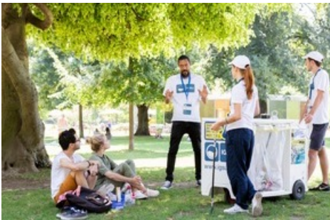
IGSU-Botschafter im Einsatz, am 7. August 2020 in Zürich.