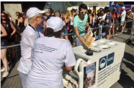
«Au Paléo Festival aussi, les ambassadeurs de l'IGSU veillent à ce que les déchets ne finissent pas par terre, mais dans des bennes.»