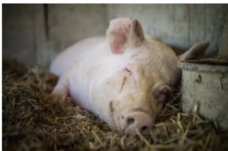
Dormir sur la paille en toute décontraction n'est malheureusement pas une réalité pour de nombreux porcs en Suisse.