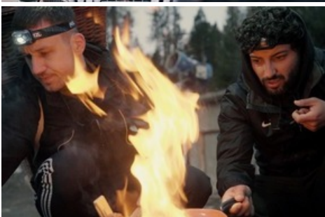
Texte complémentaire par ots et sur www.presseportal.ch/fr/nr/100014224 / L'utilisation de cette image est pour des buts rédactionnels gratuite.

Diese Meldung kann unter https://www.presseportal.ch/fr/pm/100014224/100895046 abgerufen werden.