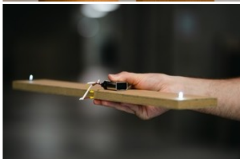
Le panneau à base de bois compte cinq couches.

Diese Meldung kann unter https://www.presseportal.ch/fr/pm/100015692/100896434 abgerufen werden.