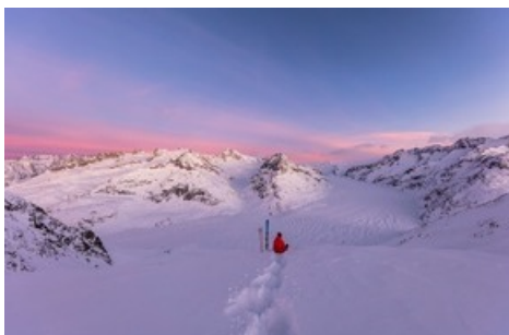
Faire du ski au grand glacier d'Aletsch