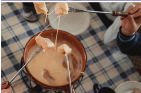
Déguster une fondue dans l'Aletsch Arena