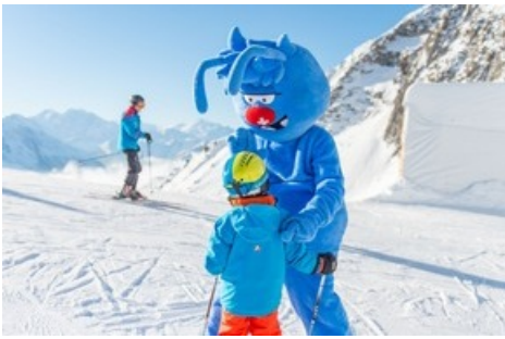
Skier avec Gletschi dans l'Aletsch Arena