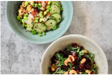
(en haut) Vegan Tokio Bowl au tofu, riz à sushi, edamame et concombre au sésame(en bas) Winter Field Bowl au blé pourpre, chou plume, airelles et betteraves