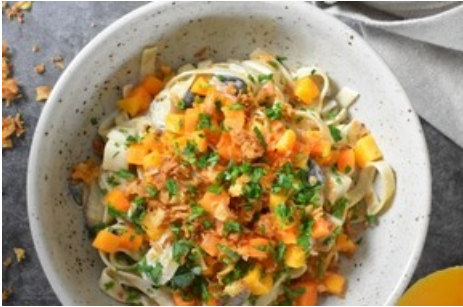
Tagliatelles aux 5 céréales avec sauce à la crème et aux champignons, potiron rôti et oignons frits

Diese Meldung kann unter https://www.presseportal.ch/fr/pm/100012819/100900696 abgerufen werden.