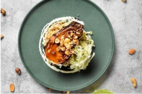
Chou pointu glacé au miso, pot-pourri de céréales avec noix grillées, et salade de pomme et de chou blanc