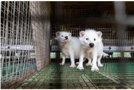
Des conditions d'élevage cruelles ont été révélées dans six fermes à fourrure choisies au hasard en Finlande.