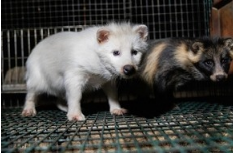
Des conditions d'élevage cruelles ont été révélées dans six fermes à fourrure choisies au hasard en Finlande.

Diese Meldung kann unter https://www.presseportal.ch/fr/pm/100004691/100901883 abgerufen werden.