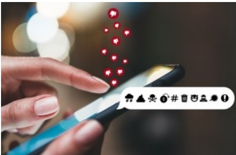
Texte complémentaire par ots et sur www.presseportal.ch/fr/nr/100014224 / L'utilisation de cette image à des fins éditoriales est autorisée et gratuite, pourvu que toutes les conditions d'utilisation soient respectées. La publication doit inclure le crédit de l'image.

Diese Meldung kann unter https://www.presseportal.ch/fr/pm/100014224/100902582 abgerufen werden.