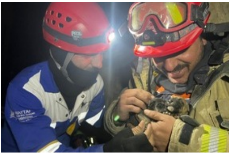
QUATRE PATTES et les ONG partenaires s'organisent pour amener une aide vitale.