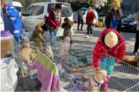
QUATRE PATTES et les ONG partenaires s'organisent pour amener une aide vitale.

Diese Meldung kann unter https://www.presseportal.ch/fr/pm/100004691/100903237 abgerufen werden.