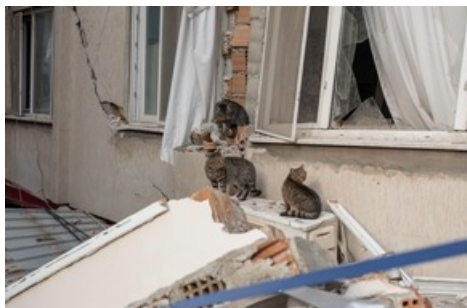
QUATRE PATTES et les ONG partenaires s'organisent pour amener une aide vitale.